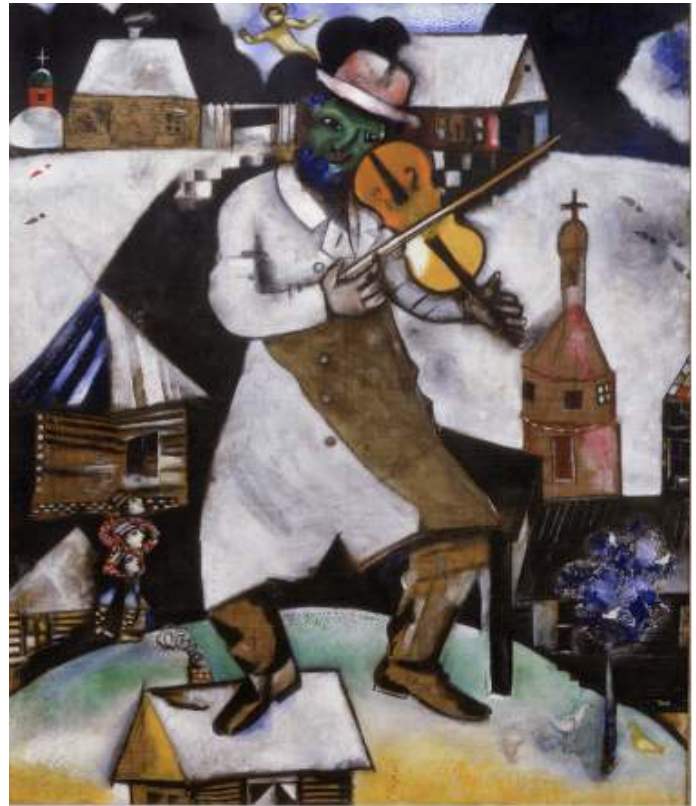
Marc Chagall: 'De violist', 1912-13, collectie Stedelijk Museum Amsterdam

Opgeven bij Lenie Celie tel .nr: 0297-283819 bij kerst- en nieuwjaarsbijeenkomst of museumbezoek.